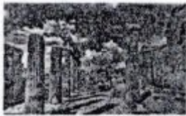
متوسط - منتهی - ۱۳۹۶

۵۹ تصویر زیر مربوط به کدام آثار باستانی است و در کدام کشور واقع شده و ویژگی این اثر چیست؟