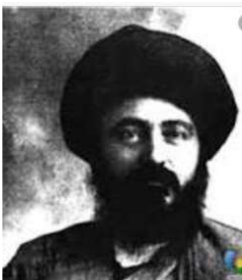
* ادیب الممالک فراهانی:

فعالیت اصلی وی روزنامه نگاری و سردبیر روزنامه « مجلس » بود شعرش از زندگی سیاسی اش جدا نبود و بسیاری از حوادث و اوضاع روزگار را بیان می نمود. دیوان وی حاوی: ترجیع بندها، قصاید و مسمط . بیشتر « قصیده » می سرود و مضمون آنها وطنی، سیاسی و اجتماعی بود.