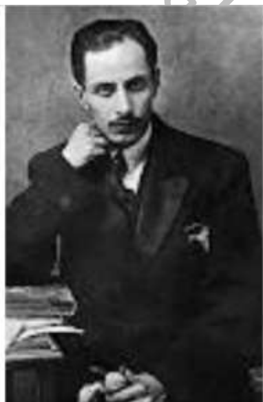
* میرزاده ی عشقی:

فعالیت اصلی وی روزنامه نگاری و سردبیر روزنامه « مجلس » بود شعرش از زندگی سیاسی اش جدا نبود و بسیاری از حوادث و اوضاع روزگار را بیان می نمود. دیوان وی حاوی: ترجیع بندها، قصاید و مسمط . بیشتر « قصیده » می سرود و مضمون آنها وطنی، سیاسی و اجتماعی بود.