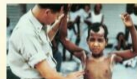
آزمایش های علمی مرگ بار روی انسان ها